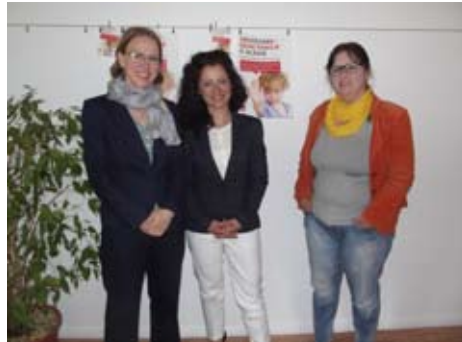
M. Hoheisel, C. Kiziltepe (MdB), M. Krahl

Finanzamt Musterhausen Musterstraße 123 XXXX Musterhausen