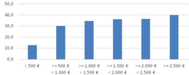
Wöchentliche Arbeitszeit pro Einkommensgruppe (Hauptjob + Nebenjob)

Stundenlöhnen werden durch Mehrarbeit kompensiert, um den Lebensunterhalt bestreiten zu können.